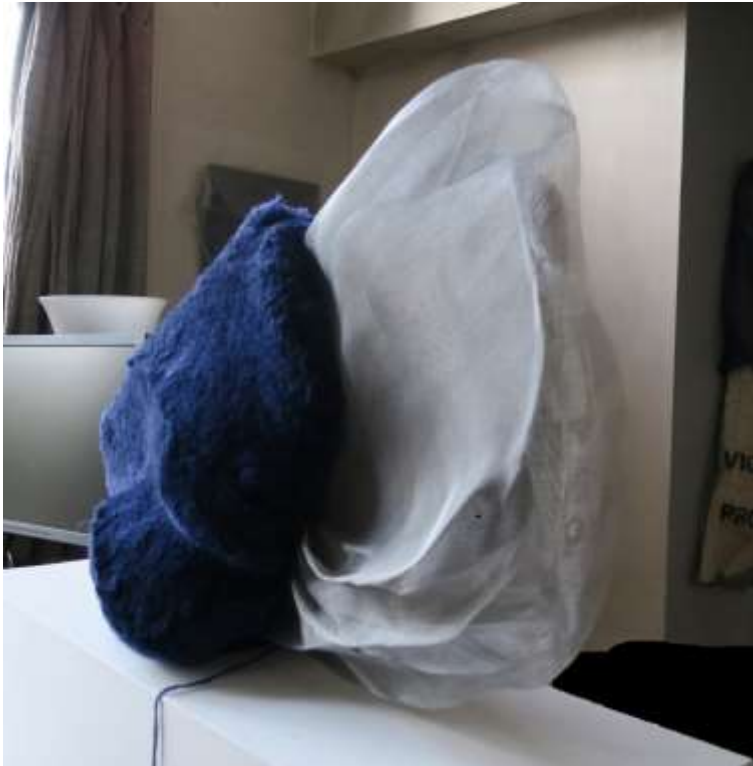
« Dedans se déploie ». 2021

The Fibery Gallery Paris, portrait d'artiste, vidéo, 2020.