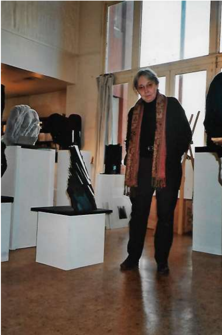
Dans l'Atelier de Paris