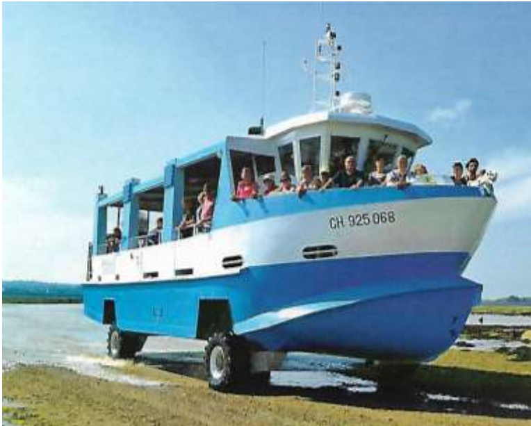
Bateau amphibie arrive