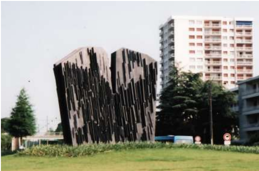
“Grande Toccato”, face sud.

65-LA GRANDE TOCCATA C'est la nuit, la Grande Toccata est désormais une des portes d'Angers.