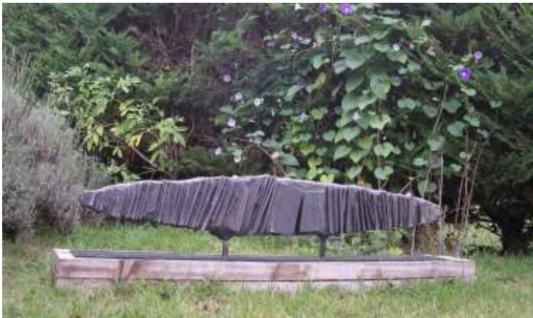
“Sculpture en ardoise dans la nature”

Avant de passer aux sculptures de plus grandes dimensions, une dernière photo d'exposition, cette fois dans mon propre atelier à Paris :