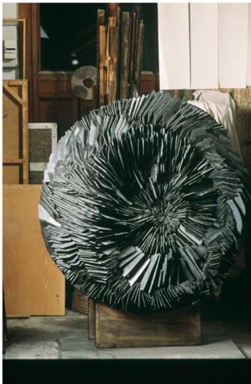
Magnificat (dans l'atelier) - 147 x 100 x 92 cm - ardoise - 1994 - coll. Musées d'Angers