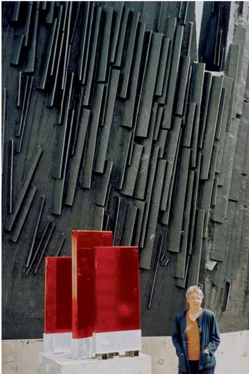
La Grande Toccata, Angers.