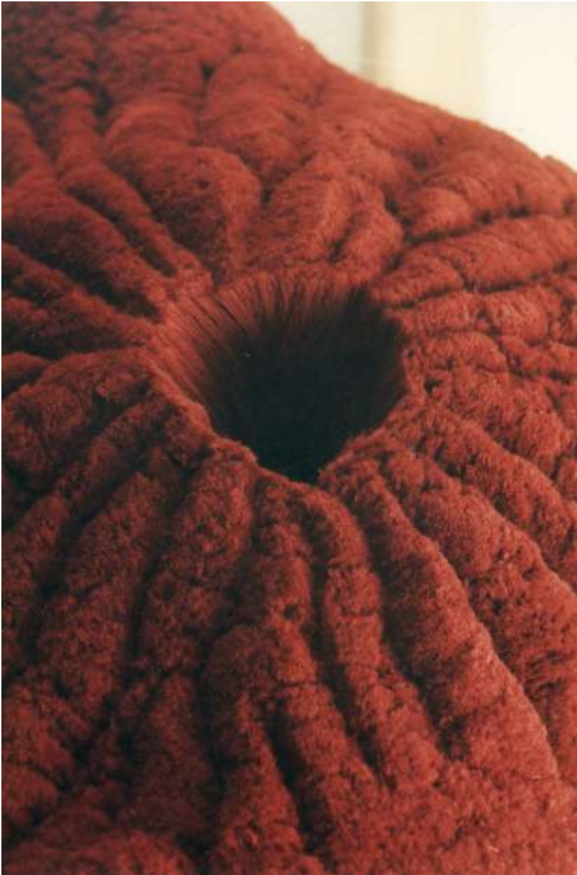
Pourpre (détail).